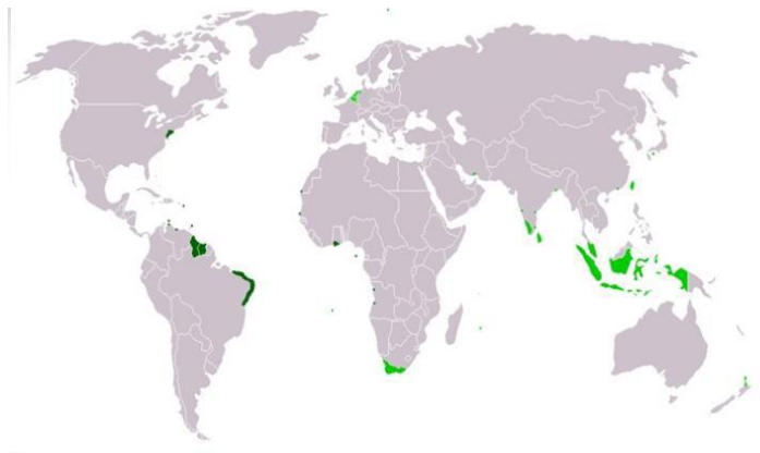
Afbeelding 3 | Overzicht van voormalig Nederlandse gebiedsdelen en handelsposten

Nederland heeft een rijke geschiedenis. Stichting Trias Neerlandica richt zich met name op de Gouden Eeuw, toen de Republiek der Zeven Verenigde Nederlanden zorgde voor een periode van economische bloei. We staan zowel stil bij positieve aspecten: de Nederlandse staatsstructuur (Verenigde Nederlanden) is later samen met de Akte van Verlatinghe en de opzet een belangrijke inspiratiebron geweest voor de Declaration of Independence van de Verenigde Staten. De VOC, het verhandelen van aandelen en godsdienstvrijheid zijn belangrijke elementen geweest. We staan ook stil bij negatieve aspecten, zoals slavernij, apartheid en oneerlijke handel in koloniën.